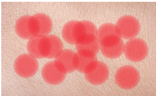
Ελεύθεροι Παλμοί αργή, η ατελής κάλυψη απαιτεί περισσότερο χρόνο